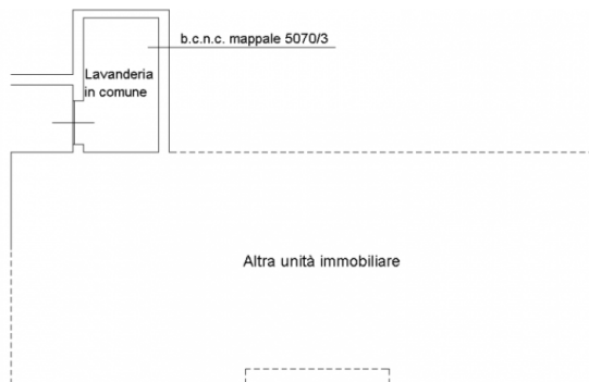
PIANO TERRA H. 3,15 MT.