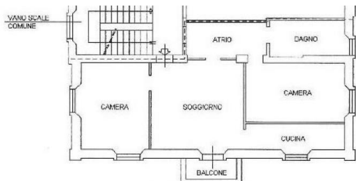
PIANO PRIMO H. = mt.2.93