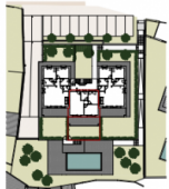
EDIFICIO A - APPARTAMENTO A2