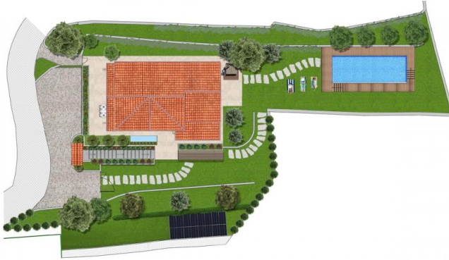
Menaggio - Villa Bellagio Planimetria Generale