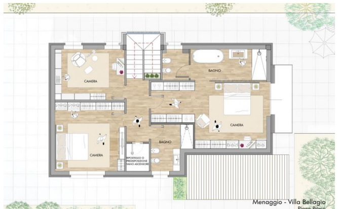
Menaggio - Villa Bellagio Piano Primo