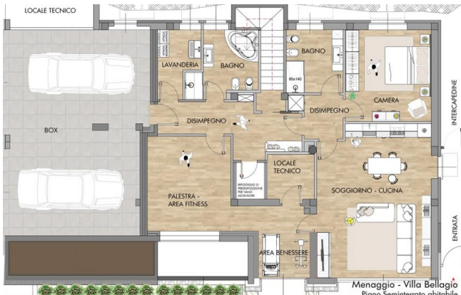
Menaggio - Villa Bellagio Piano Seminterrato